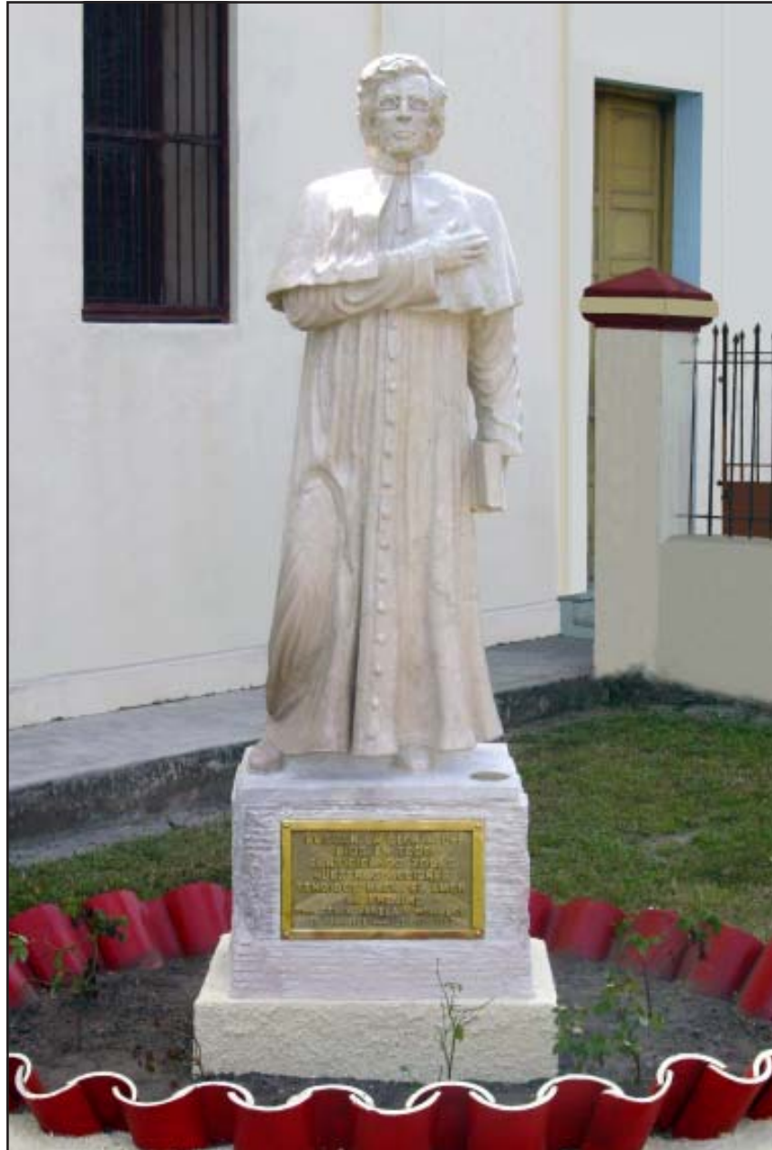
Padre Félix Varela ;Ruega por nosotros!