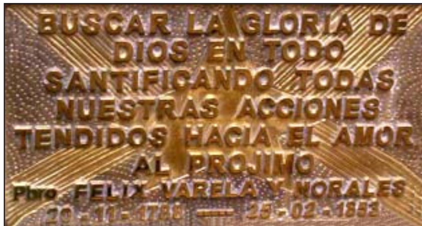
Tarja en la base de la estatua.

En cada ocasión que pasemos frente a su imagen en los jardines de nuestra Catedral, aprendamos de él y dirijámosle a Dios, por intercesión del Padre Varela, una ferviente plegaria por Cuba y por su Iglesia, una oración por la libertad, la fe y la virtud.